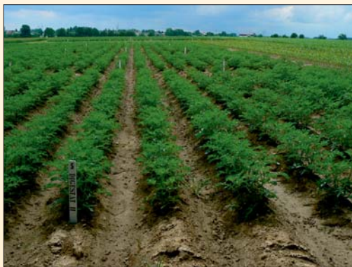
Porost brambor, stanice Lípa

K bramborám bylo hnojeno 120 kg N a k silážní kukuřici 150 kg N v hnojivu LAV 27. Na tuto hladinu dodaného minerálního hnojiva byly dopočítány dávky organických hnojiv, tj. kejdy prasat, digestátů a kompostu. Výsledky v tab. 4 dokumentují mírně nižší účinnost obou digestátů oproti minerálnímu hnojivu. Oproti variantě s LAV 27 byl výnos nižší o 6,79–9,46 %. Velmi dobře výnosy ovlivňuje kejda, což je způsobeno zvláště vyšším obsahem lehce hydrolyzovatelné organické hmoty, která v digestátu chybí.