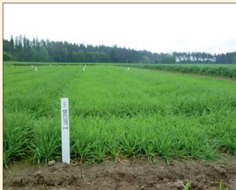
Porost ječmene, stanice Hradec nad Svitavou