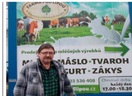
Farma pod lipou