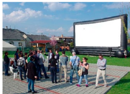
MAS Šumperský venkov – pojízdné kino

Během exkurze měli návštěvníci možnost seznámit se s více než 20 projekty realizovanými většinou s podporou programu LEADER.