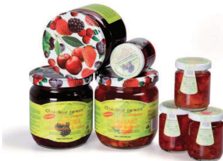
Kategorie: alkoholické a nealkoholické výrobky (s výjimkou vína)