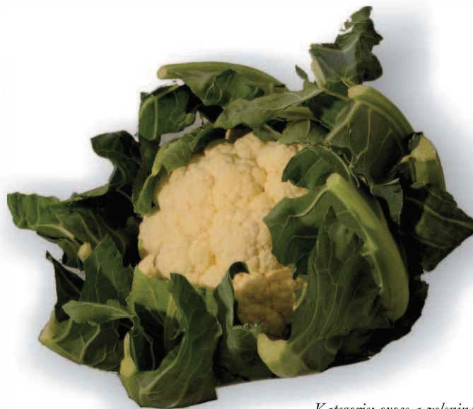
Kategorie: ovoce a zelenina