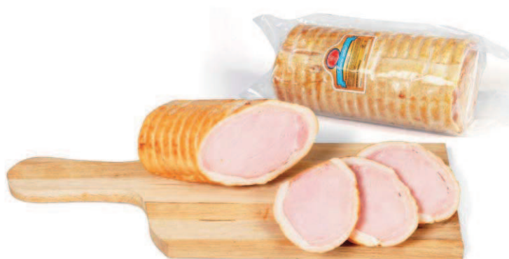
Kategorie: masné výrobky