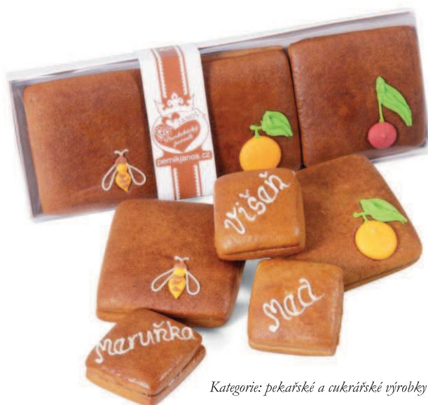
Kategorie: pekařské a cukrářské výrobky