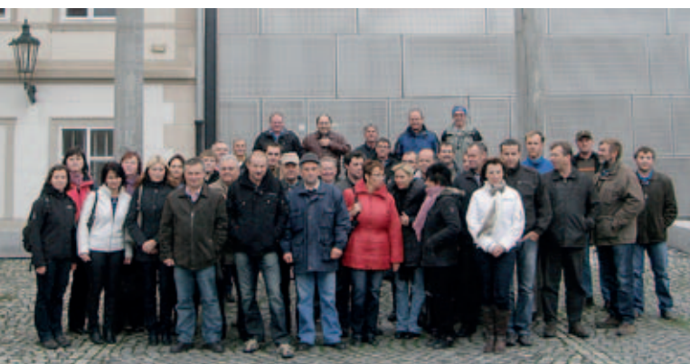
Účastníci před chmelařským muzeem v Žatci

Návštěva tří krajů umožnila partnerům Celostátní sítě pro venkov z trebičského okresu navázat mezi sebou bližší kontakty a vyměnit si vzájemné zkušenosti. Poznali řadu realizovaných projektů ve všech navštívených lokalitách a seznámili se s přístupy místních aktérů Sítě a s možnostmi čerpání podpory pro zemědělství a venkov.