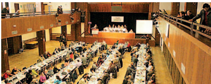
Pohled do sálu při slavnostním semináři „Brambory 2012“

Vlastní setkání pěstitelů, zpracovatelů i výzkumníků však zahájila odborná konference na téma „Nová pravidla a zvyklosti obchodu s bramborami v Evropě“, která se uskutečnila v Havlíčkově Brodě předchozí den. Hlavní