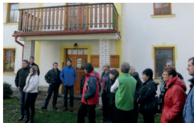
Dům jógy v Hlavici