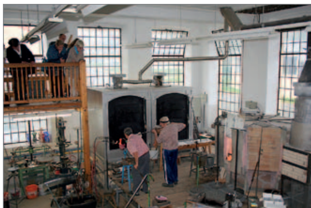
Z celé řady exkurzí přinášíme snímek z návštěvy sklárny v Nagelbergu (Workshop B)