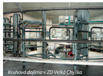
Kruhová dojrna v ZD Velká Chyška

s kruhovou dojárnou pro 24 dojnic a s jímkami na kejdu. Studenti si dále prohlédli také bramborárnu, kde se brambory skladují v 900 kg bednách. Poslední zastávkou byla společnost Selekt Pacov, a.s. Zdejší mléčná farma s kapacitou 270 ks dojnic využívá k získávání mléka dojící roboty Lely Astronaut. Farma se neustále rozšiřuje a modernizuje, z Programu rozvoje venkova se realizoval projekt „Stavební úpravy stáje a dojícího robota“ v rámci opatření I.1.1 Modernizace zemědělského podniku. V podnikové šlechtitelské stanici Hrádek účastníci viděli skleníky, kde se šlechtí nové odrůdy brambor.