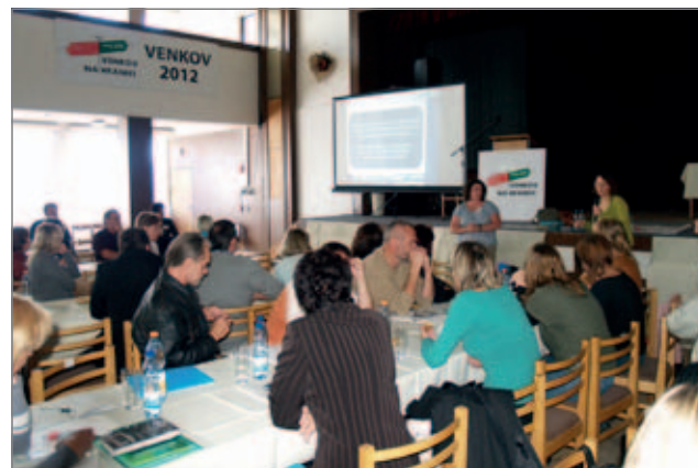
Jak na komunitní workshopy prakticky předvedly představitelky místní akční skupiny PLANED z Walesu