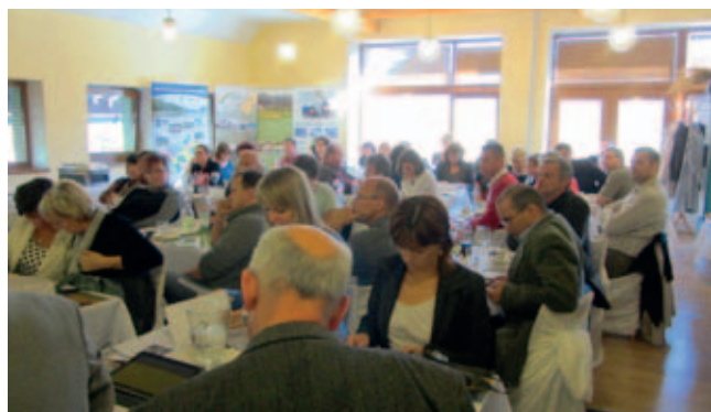
Pohled na účastníky semináře ze Zlínského a Olomouckého kraje