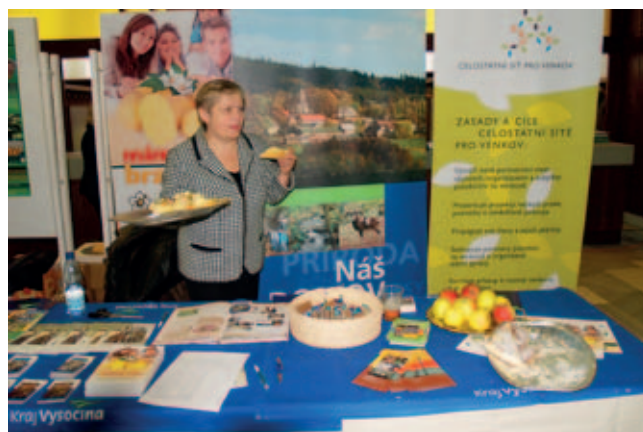
Společný stánek Kraje Vysočina, KAZV Jihlava a Celostátní sítě pro venkov