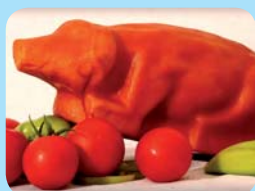
Zdeněk Kořínek Šunkové prasátko