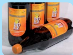
Medovinka, s.r.o. Thorovo kladivo