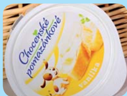
Choceňská mlékárna s.r.o. Choceňské pomazán- kové – vanilka