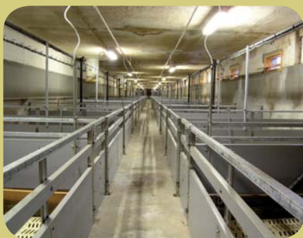
VEMAS a.s. Poskytnutá dotace: 749 444 Kč Rekonstrukce ustájení prasat – I. etapa