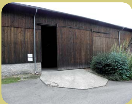
Pavel Kaplan Poskytnutá dotace: 143 065 Kč Rekonstrukce střechy stodoly – výměna střešní krytiny

Ať si dodají odvahy a určitě neváhají, ale musí se připravit na delší administrativní cestu.