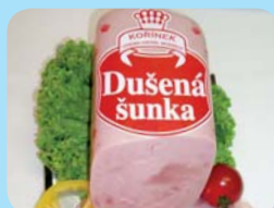
Zdeněk Kořínek Dušená šunka