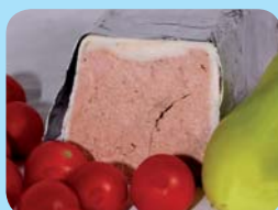
ZEAS, a.s. Pod Kunětickou horou Játrový sýr se šunkou