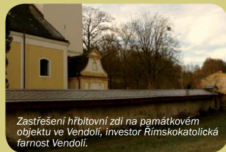
Zastřešení hřbitovní zdi na památkovém objektu ve Vendolí, investor Římskokatolická farnost Vendolí.

Zvláště bychom přivítali větší zájem a odvahu žádat o dotace u zemědělských podnikatelů, byť s ohledem na poměrně nízký objem alokace dotačních prostředků naší MAS, může jít jen o investice spíše drobnější nebo strojní povahy. Mírně jim zaručit, že žádosti podané prostřednictvím našeho občanského sdružení, se setkají s daleko menší konkurencí, nežli žádosti podávané individuálně přes SZIF. Jsme připraveni podávat informace a zodpovídat dotazy, nejlépe prostřednictvím e-mailu na massvitava@svi.cz .