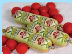
ZŽUD Masokombinát Polička, a.s. Paštika s olivami