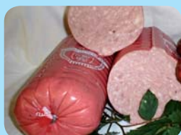
Zemědělské družstvo Rosice u Chrasti Lunch - meat