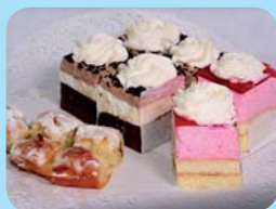
Cukrárna „Na výsluní“ Jogurtový čokoládový řez