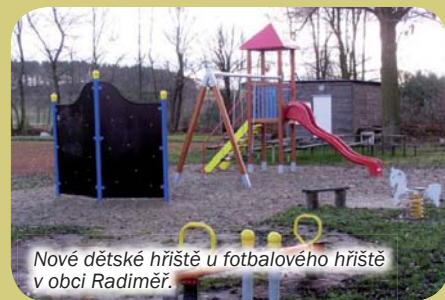
Nové dětské hřiště u fotbalového hřiště v obci Radiměř.