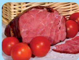
BOCUS, a.s. Uzená hovězí kýta