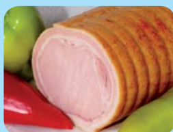
Řeznictví uzenářství Francouz s.r.o. Radní rolka