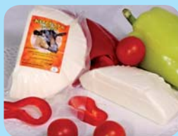
Kozí farma Licibořice Pařený kozí sýr