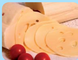
MILTRA B s.r.o. ARTUŠ – přírodní salámový polotvrdý sýr