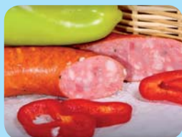
BOCUS, a.s. Libový kabanos