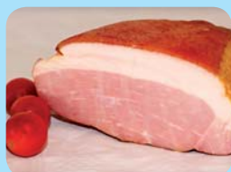
Zdeněk Kořínek Sedlácká kýta