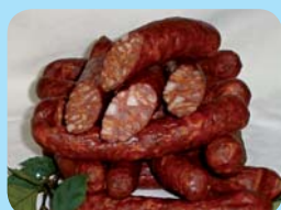
Zemědělské družstvo Rosice u Chrasti Jehněčí klobása