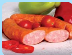
MASOEKO s.r.o. Klobása s tvarůžky