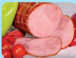
MASOEKO s.r.o. Zámecká šunka