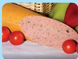
Řeznictví uzenářství Francouz s.r.o. Paštika s medvědí česnekem