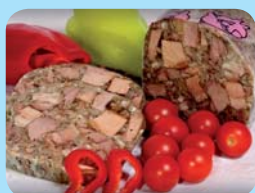
Řeznictví Sloupnice s.r.o. Sloupnická tlačěnka