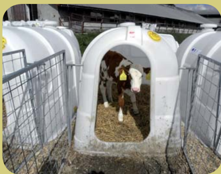
Kunvaldská a.s. Poskytnutá dotace: 350 000 Kč Boudy pro telata

Ničeho se neobávejte a zkuste to, při současné krizi v zemědělství se projekty bez finanční podpory velmi těžko realizují.