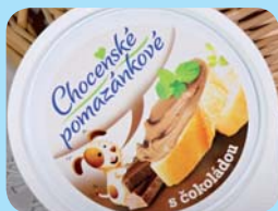
Choceňská mlékárna s.r.o. Choceňské pomazán- kové s čokoládou