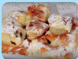
Cukrárna „Na výsluní“ Brandýské máslové koláče