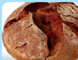
Pekařství a cukrářství Sázava s.r.o. Žitno-pšeničný chléb