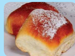
Smékalovo pekařství spol. s r.o. Buchta ovocná (švestka, meruňka)