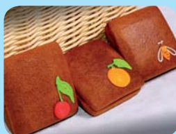
Pavel Janoš Pardubický perník - sada