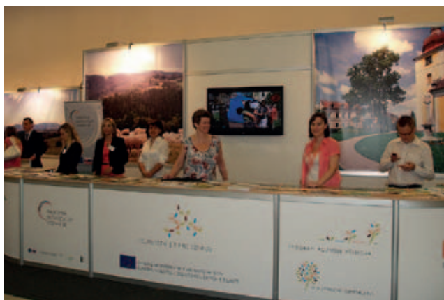
Informační stánek Celostátní sítě pro venkov