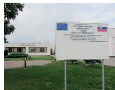
Revitalizovaný střed obce Slovenský Grob

Velké množství dotazů směřovalo na projekt „Využití energie malých vodních zdrojů, jako součást energetické soběstačnosti obce“ a zaujal je námět na projekt „20 20 20 do roku 2020“ , do kterého chceme zahrnout některé doporučené postupy pro obce k naplnění legislativního balíčku EU zaměřeného na boj proti klimatickým změnám a zlepšení bezpečnosti a konkurenceschopnosti v oblasti dodávek energií. Na tuto oblast bude zaměřena naše spolupráce.