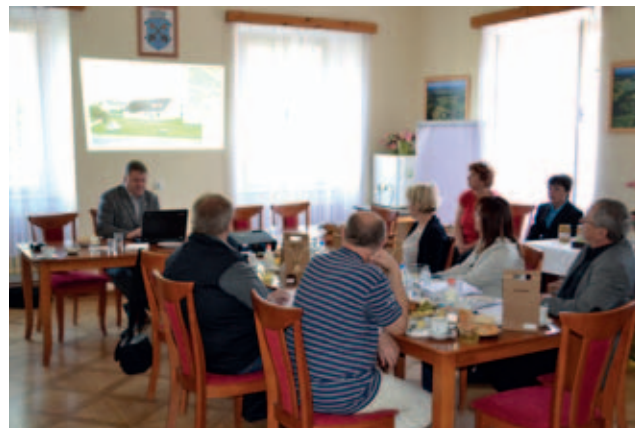
Zasedání hodnotitelské komise