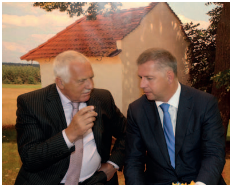
Prezident republiky Václav Klaus při sobotních Národních dožínkách navštívil expozici Ministerstva zemědělství, kde ho přivítal ministr Petr Bend