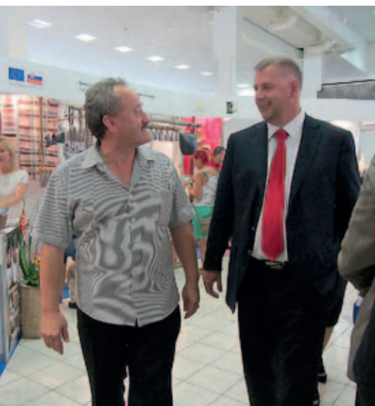
Ministr Petr Bendl na Agrokomplexu v Nitře v doprovodu manažera MAS Poodří

V druhé polovině srpna (22. – 24. 8. 2012) připravila Krajská síť pro venkov ve Středočeském kraji setkání partnerů Sítě s partnery Siete vidieka v Nitranském regionu.