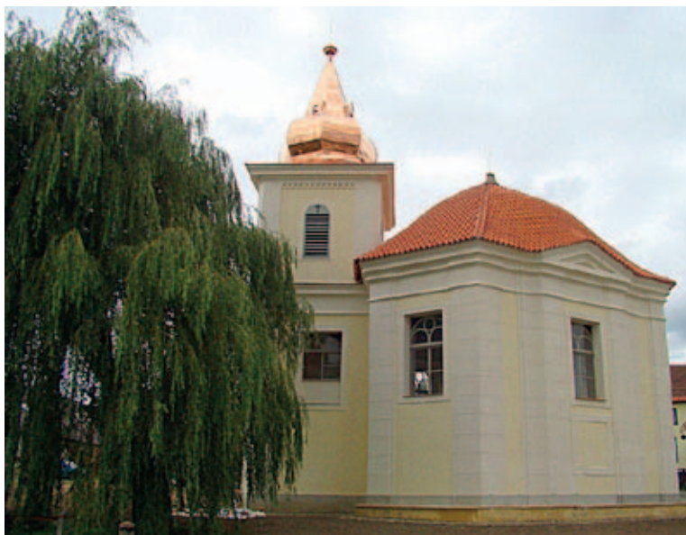
Opravená kaple sv. Václava a Vojtěcha v Ostrově u Stříbra, obec Kostelec