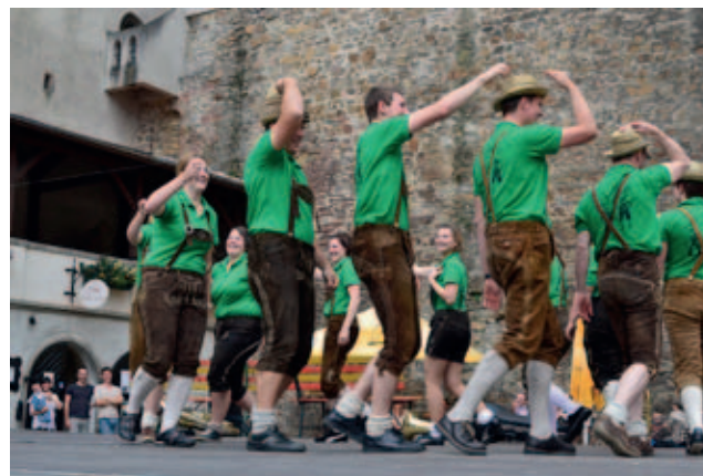
Ukázka tyrolských lidových tanců

Všichni partneři projektu, který je teprve v začátcích, chápou rozvoj venkovských regionů jako svoji prioritu. www.strakonicko.net/mas/