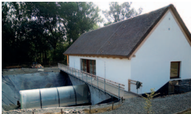
Obec Modrá - projekt podpořený z Programu příhraniční spolupráce

Obec Lipót , která je nositelem zlaté plakety Evropské soutěže Entente Florale Europe, byla dalším zajímavým místem, který jsme v rámci exkurze navštívili. Navštívené projekty měly jednoho společného jmenovatele – vodu. V prvním případě to byla léčivá voda z termálního vrtu, který zde byl proveden zhruba před deseti lety. Výstavba lázně, která byla podpořena z dotačních titulů se během krátké doby stala vyhlášenou atrakcí, která do území přivedla velké množství návštěvníků. To vyvolalo potřebu dalších investic a v současné době obec žije čilým cestovním ruchem. Druhý projekt spjatý s životodárnou tekutinou je projekt zaměřený na poznání území zahrnutého do soustavy NATURA 2000. Vybudované pozorovatelné a připravené programy umožňují blíže se seznámit s úchvatným životem v oblasti slepých ramen Duna. Balatonboglár opět nabídl možnost seznámit se s tím, jak je možno zahrnout místní regionální tradice z oblasti způsobu života a stravování do podnikatelských záměrů.