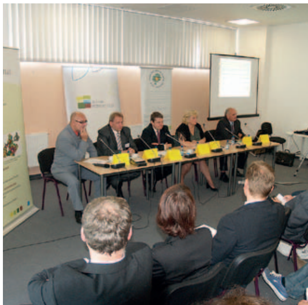
Velký zájem byl o všechny přednášky v rámci odborného doprovodného programu – záběr ze semináře „Pozemkové úpravy, šance venkova v následujícím programovém období“

- „ Podpora rozvoje venkova v ČR “. Seminář připravil SPOV spolu s MZe a Ministerstvem pro místní rozvoj, jehož záměry prezentoval ministr Kamil Jankovský. Za Ministerstvo zemědělství přednesl příspěvek zaměřený na nové programové období 2014–2020 ředitel odboru Řídicí orgán