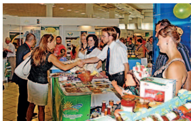
Maďarská expozice na výstavě Agrokomplex v Nitře

Stálý sekretariát (HNRN PS) , který se účastní jednání vedených pro