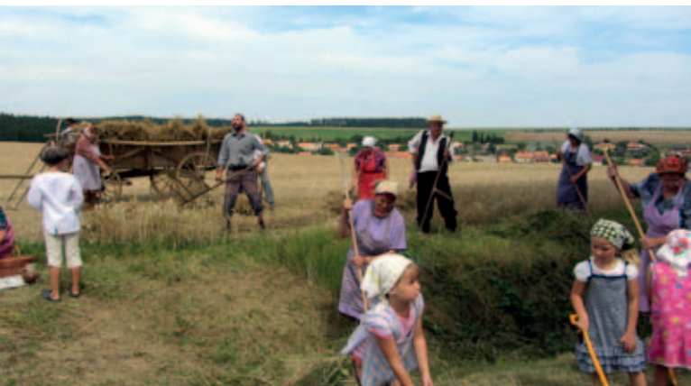
Ukázka zemědělských aktivit v období žní v obci Rudka

Letošní ročník soutěže znovu ukázal, že rozvoj venkova se zemědělstvím úzce souvisí a dobře nastavená vzájemná spolupráce je přínosná pro všechny obyvatele dotčeného regionu.