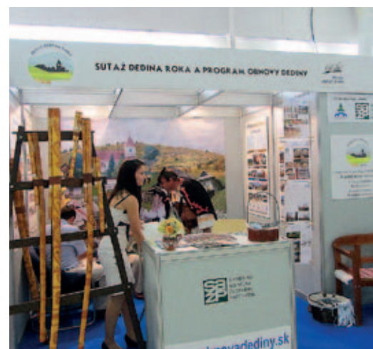
Stánek „Dedina roka“ na výstavě Agrokomplex