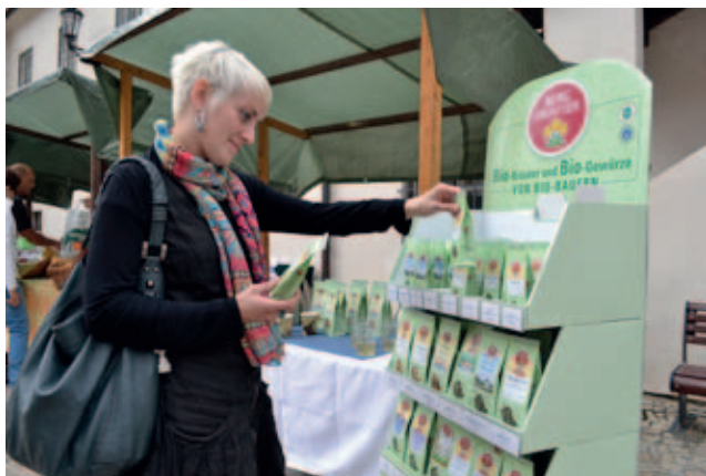
Výběr rakouských bylinek ve Strakonících

Nový projekt je podpořen v rámci Fondu malých projektů z Evropského fondu pro regionální rozvoj a pokračuje v prezentaci lidové kultury a řemesel obou regionů. Jde o projekt zrcadlový, žádost podaly obě strany a obě dotaci také získaly. Hirschbach svým projektem představil 21. července svoje proslulé bio-bylinkářství a další řemesla na hradě ve Strakonících. MAS LAG Strakonicko zase svou část projektu prezentovalo v Hirschbachu 9. září. V ten den se konala jedna z největších akcí v regionu tzv. Bylinkové posvícení. Celodenní program doplnili strakoničtí ukázkou našich řemesel, dudáckou muzikou a na prostranství před budovou muzea postavili „jihočeskou vesničku“, ve které se představili naši výrobci s certifikovanými produkty, které získaly regionální značku.