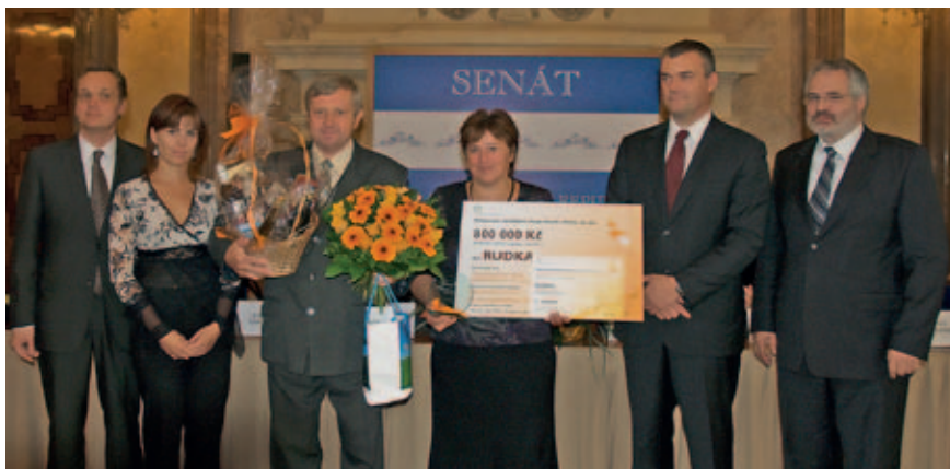
Titul „Oranžová stuha 2012 ČR“ získala obec Rudka z Jihomoravského kraje (okres Brno-venkov)

Hodnocení probíhalo v následujících oblastech: podíl místních zemědělských subjektů na zaměstnanosti obyvatel obce, péče o veřejná prostranství a kulturní krajinu, koncepční dokumenty a společné projekty, místní produkty a jejich marketing, využití netradičních zdrojů energie, nezemědělské aktivity. Neméně důležitou složkou hodnocení byl také zvolený způsob prezentace, jakým se jednotlivé obce představily. Při putování po obcích v jednotlivých krajích členové komise konstatovali, že v jednotlivých obcích je spolupráce se zemědělský-