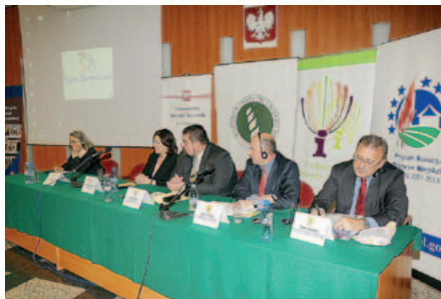
Hosté na mezinárodní konferenci konané na veletrhu AGROTRAVEL

- studijní výjezdy pro novináře a účastníky konference na nejzajímavější místa venkovské turistiky v okolí Kielc