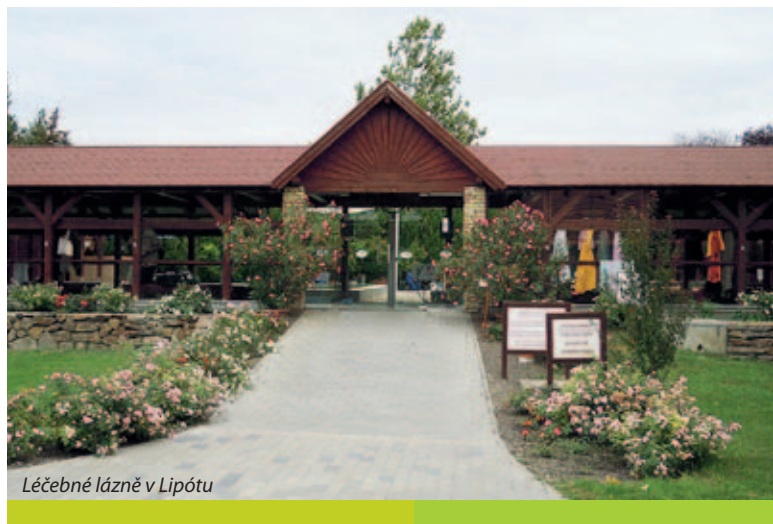
Léčebné lázně v Lipótu