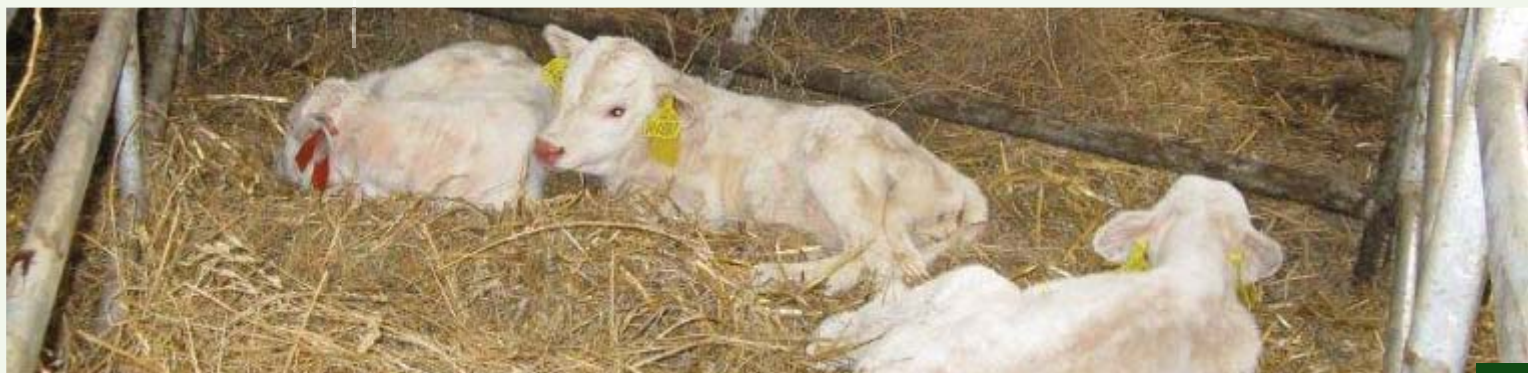
Trojčata plemene Charolais, foto Spojené farmy a.s., 2011